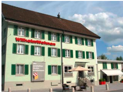
8732 Neuhaus / Eschenbach